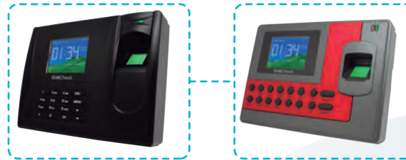
Modelos de Reconocimiento de Huella Digital.

Se deben de tomar en cuenta los siguientes parámetros: